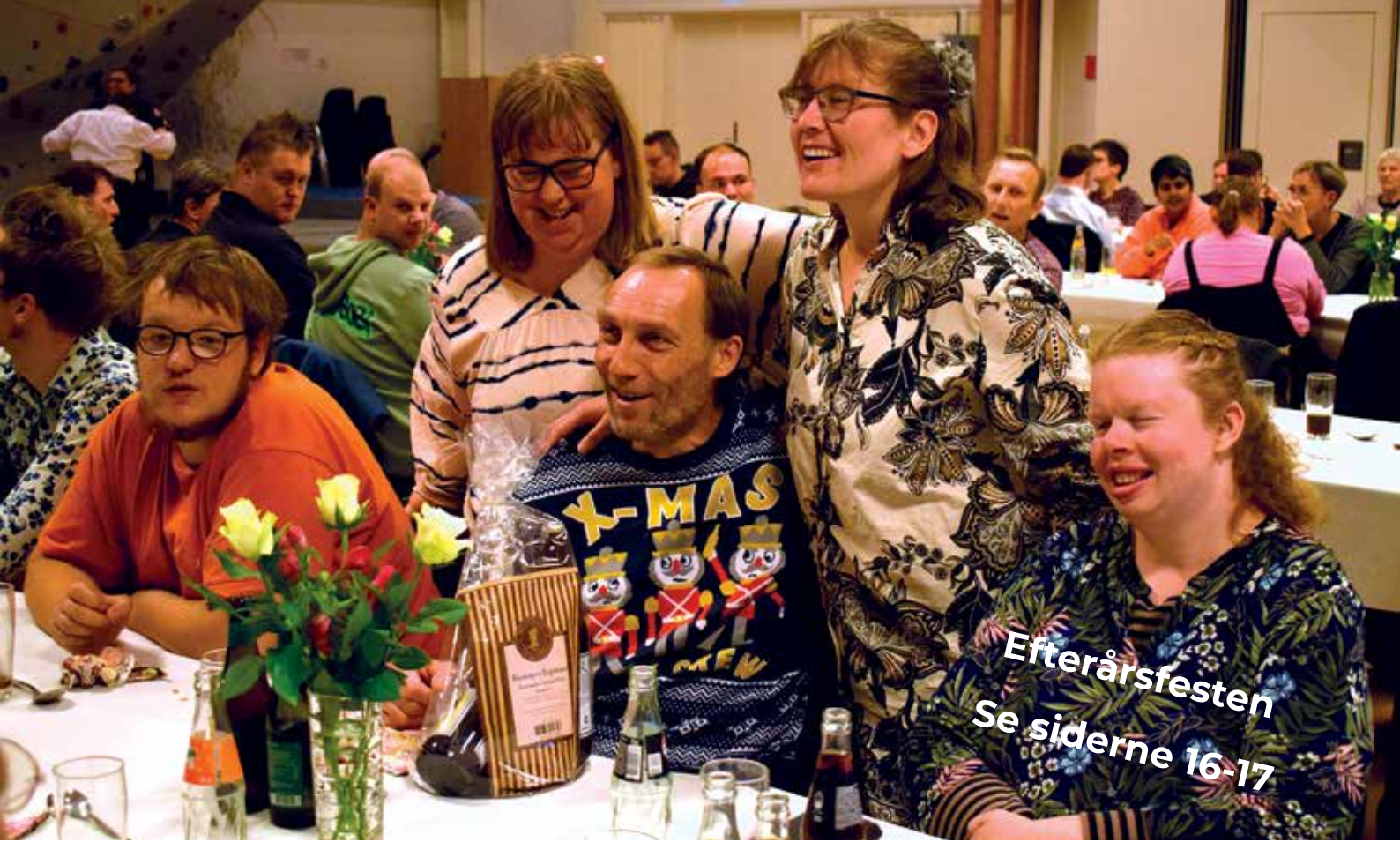
Efterårsfesten Se siderne 16-17