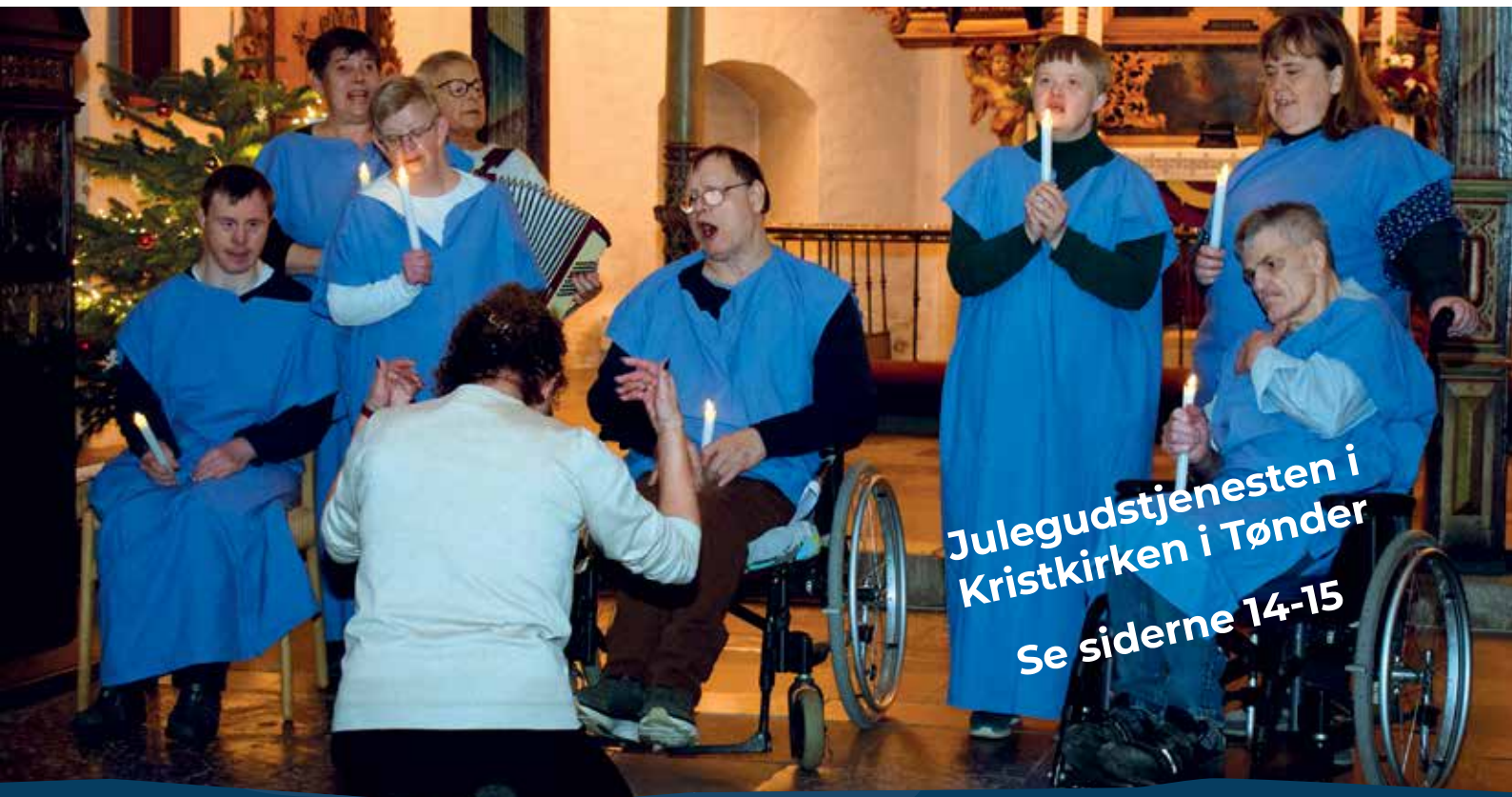
Julegudstjenesten i Kristkirken i Tønder Se siderne 14-15