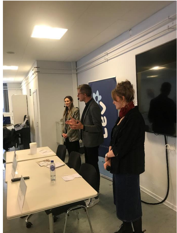
Så blev det politikernes tur

På den anden og afsluttende paneldrøftelse blev politikere fra Odense Kommune bedt om at forholde sig til de problemstillinger, der var blevet rejst på dagen. Indtrykket var, at de deltagende politikere havde fået et mere nuanceret syn på, hvordan man bør bygge boliger til mennesker med udviklingshandicap