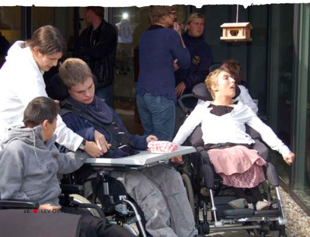
Indvielse af Specialcenter syns- og hørehæmmede

Arbejdet med at etablere boligerne er godt i gang. I 2007 og 2008 har