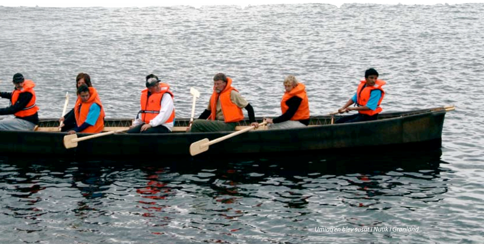
Umiaq'en blev søsat i Nuuk i Grønland

føle mig sat lidt til side. Som ny leder i Vasac Sorø har jeg kun lidt erfaring i at være sammen med mennesker, der er udviklingshæmmede, mennesker med autisme og mennesker uden talesprog. På Åmosen har flere af brugerne alle tre handicaps. Men det, som slog mig, var, at jeg meget hurtigt slappede af i selskabet med folkene fra Åmosen. Hele stemningen derude inviterer til ro og godt samvær. En stille accept af at jeg er mig, og du er dig, og vi har begge noget at give hinanden, hvis vi vil det.